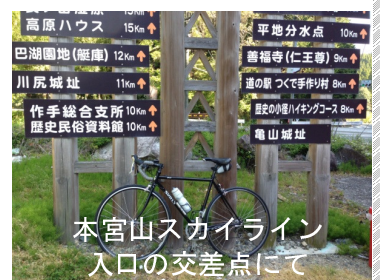
本宮山スカイライン 入口の交差点にて

とにかくこのジャンボフランクは絶対オススメ。別に自転車でなくてもいいので車でいかがか・・・(^.^)