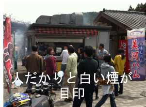
人だかりと白い煙が目印

しい白い煙。周囲には人だかりが。何だろうと近づいてみると何十本ものフランクフルトが炭火の上に並んでいます。あたり一面香ばしい香りが・・・↗