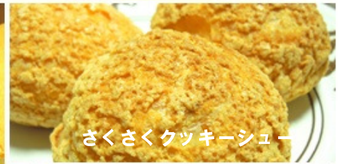
さくさくクッキーシュー