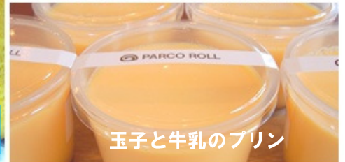
玉子と牛乳のプリン

人気メニューはやはり看板商品のロールケーキです。焼(しょう)ロール(880円)、たまごロール(600円)、フルーツロール(680円)等々勢揃いです。それから表面がカリカリのさくさくクッキーシュー(130円)、名古屋から取り寄せの手作りラスク(398円)などが並びます。お話を伺っている最中もお客様がひっきりなしに訪れ店内は活気に満ちています。