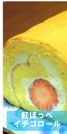
紅ほっぺイチゴロール