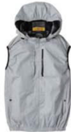
スモークアッシュ